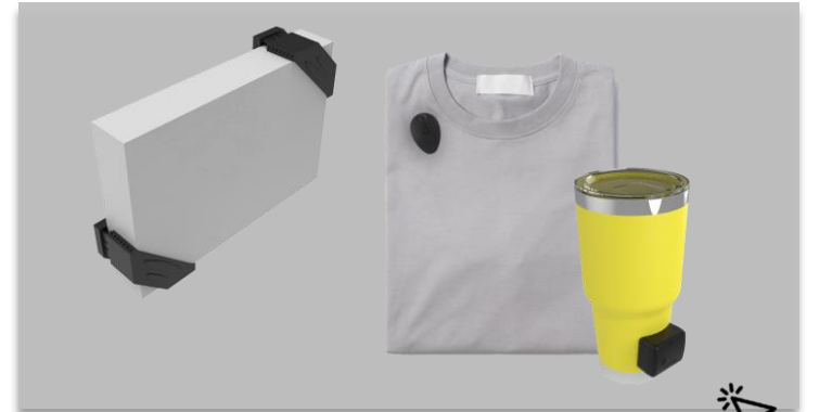
Nuestros productos destacados