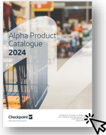
Ver catálogo ALPHA