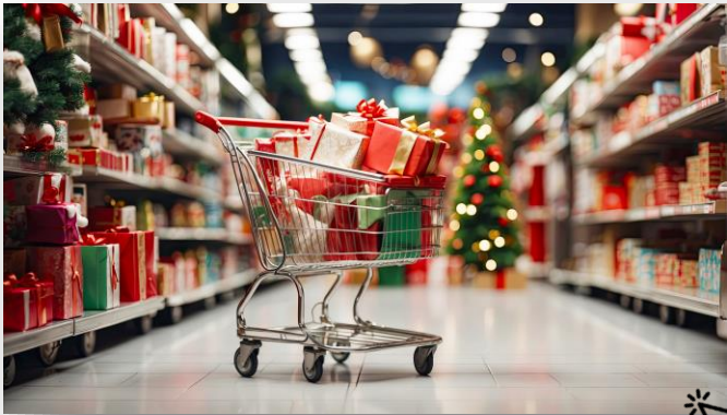
El hurto en Navidad: datos & consejos de protección