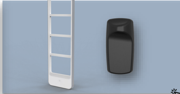
Kit de protección Checkpoint