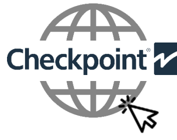
Visita nuestra WEB